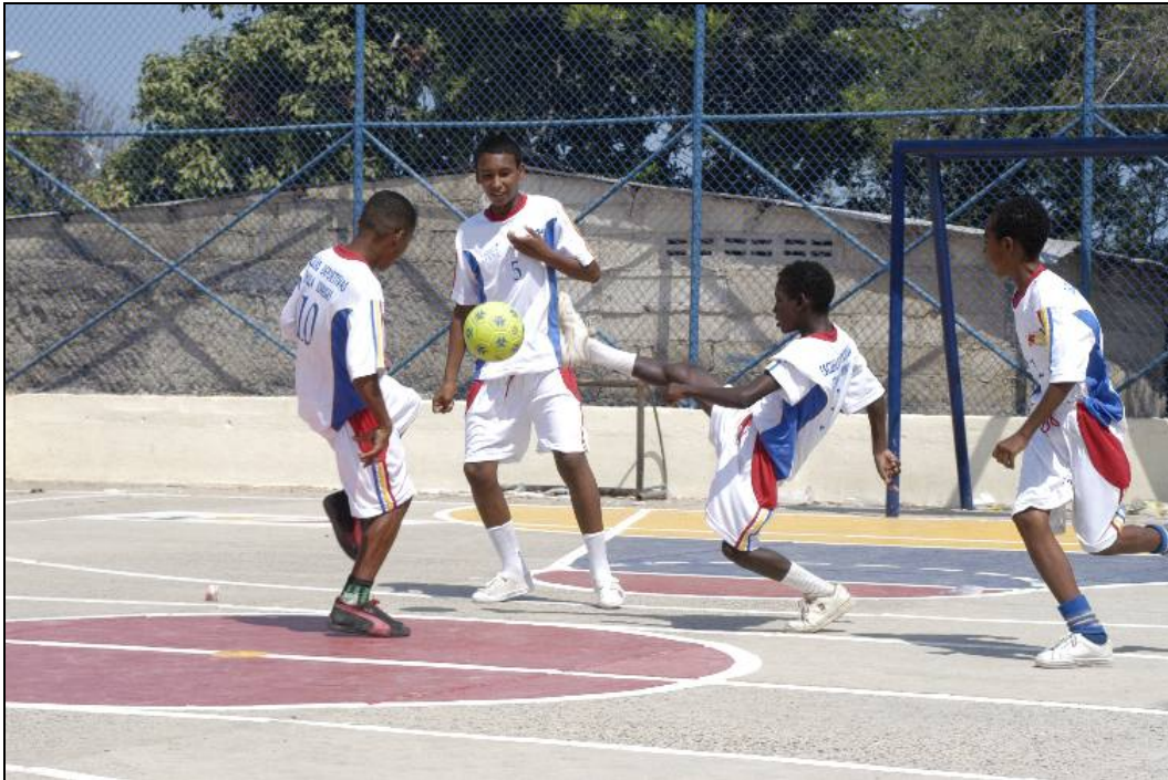
Las actividades positivas como el deporte ayudan a mantener a los jóvenes lejos de las influencias negativas.

Gracias a nuestro Programa de Jóvenes, los jóvenes tienen la oportunidad de participar en actividades y eventos divertidos como atletismo, teatro, música y excursiones educacionales, los cuales ayudan a desarrollar el trabajo en equipo y representan avenidas positivas para pasar el rato sin la presencia de drogas, pandillas y violencia.