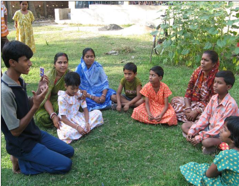
Miembros de nuestro Cuerpo de Salud de Jóvenes en India enseñan a otros niños apadrinados y miembros de la comunidad sobre temas importantes de la salud.

El Cuerpo de Salud de Jóvenes (CSJ) está diseñado para reducir las enfermedades prevenibles, el abuso de las drogas, las enfermedades sexualmente transmitidas y los embarazos precoces. Nuestras agencias entrenan a los jóvenes apadrinados para que sirvan de educadores de sus compañeros, quienes en cambio educan a otros durante presentaciones informales. Desde 2005, más de 1,000 jóvenes apadrinados en ocho países han sido capacitados para ser educadores inter pares.